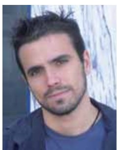
Alberto Garzón Espinosa