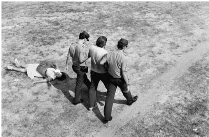
Desallotjament d'una fàbrica a Parets del Vallès (agost, 1986)

Però hem de recordar que l'any 1976 un treballador acomiadat de manera "improcedent" tenia dret a triar entre quedar-se a l'empresa o una indemnització de 60 dies per any treballat, amb un límit de 5