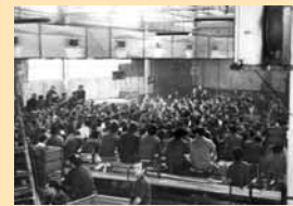
Assemblea de Roca (1976)

La política pactista dels sindicats oficials, la dretanització política i el procés d'integració europea han suposat importants retallades en drets laborals. Ras i curt, la classe obrera tenia més drets laborals el 1976 que avui en dia.